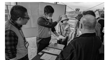
活動マッチングにてボランティアに活動内容を伝える様子