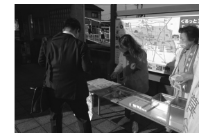
石見駅での街頭募金 (R5年)