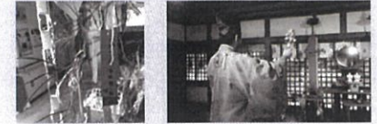
(鏡作神社の使用許可を頂いて掲載しています)

あざさ苑正面入り口に設置しておりました笹飾りに結んでいただいた短冊は、田原本町にある「鏡作神社」に奉納し、皆さまの願いが叶いますようにお祈りしていただきました。たくさんのご参加ありがとうございました。 今後も、あざさ苑のイベント事業にご参加いただけますよう宜しくお願い致します。