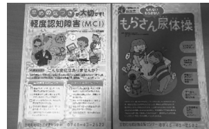
介護予防 パンフレット配布

「相談も用事もないよ!」・そんな方も一度来て下さい。 ぜひ一度のぞいてみてくださいね。