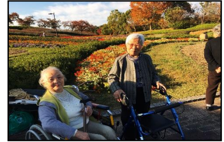
外出 (馬見丘陵公園)