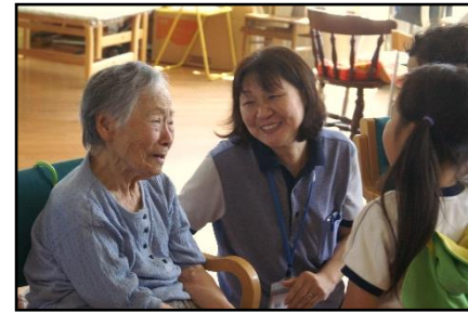
三宅町幼稚園交流会